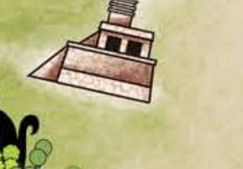
Ilustración que nos muestra el Observatorio en su época de esplendor.